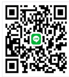
110-新住民語文競賽群組